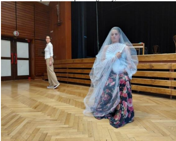
Master Classes Devín 2023