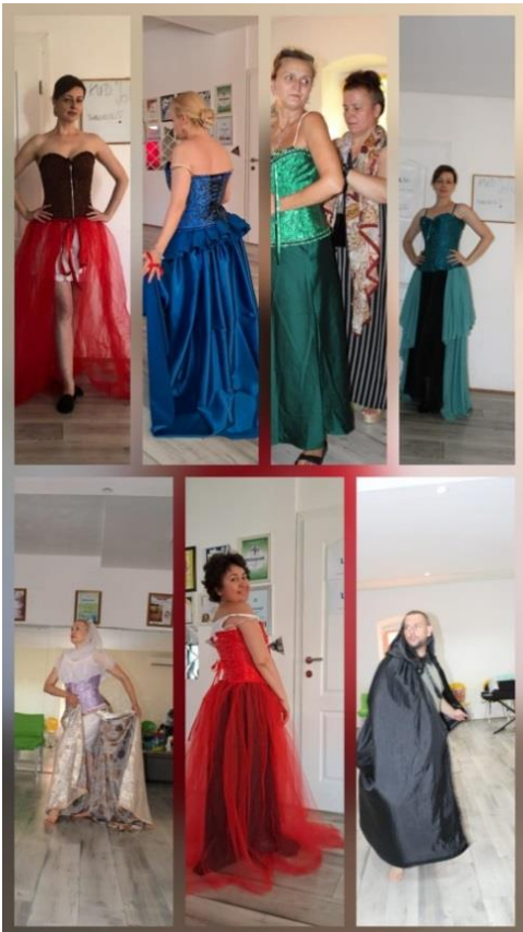
Príprava kostýmov Jelsa 2025