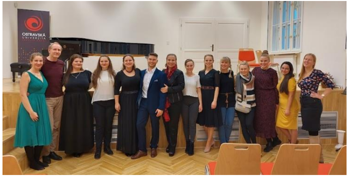
Workshop UNI Ostrava 2022