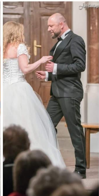
Don Giovanni – Japan 2016