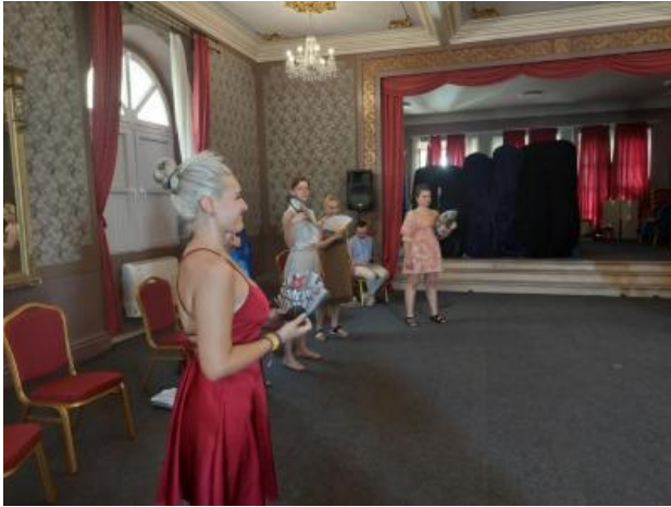
Vytváranie dramatickej postavy, Jelsa 2024