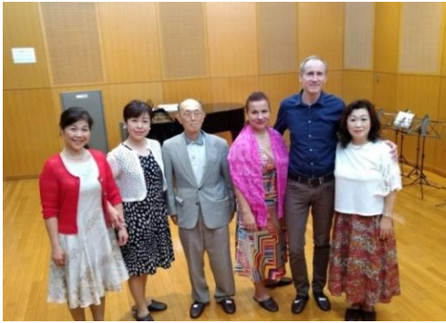
Workshop Opera Operetta Fukushima 2018