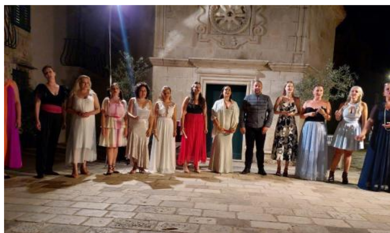
Koncert Popular Opera Melodies, Jelsa 2024