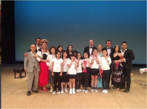
Maritza + Zauberflöte Japan