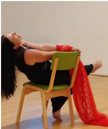
Workshop Hvar 2023