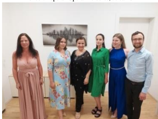
Koncert slovenských piesní, Vrbanj 2022