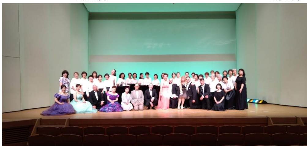
Workshop Fukushima 2018- the Final concert