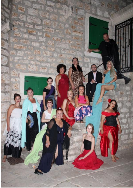
Po predstavení Opemé fragmenty, Jelsa 2024