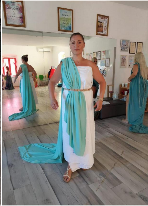
Príprava kostýmov, Jelsa 2024